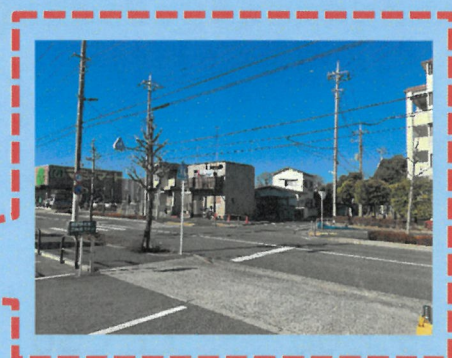
マミーマート 足立島根店